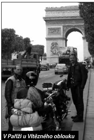
V Paříži u Vítězného oblouku

Středa (400km) - Po prvním vcelku levném nákupu v supermarketu jsme se vydali na placenou dálnici směr Mentz, Reims