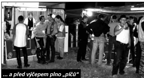
... a před výčepem plno „píčů“

Hlavní dávka motorkářů se ovšem očekávala na sobotu. Každý z pořadatelů však v duchu tušil, že účast nepřekročí loňský rok. Ten nahoře totiž přihodil na dny srazu nějaké to polínko do ohně, a tak teplota na slunci přesáhla optimální chlastací průměr. Takže i přes zájem médií, jako Kutnohorský denník, kde vyšlo pár upoutávek a článků o akci, bylo dost lidí přednost kupání před spařením se na Festlejt. I přes to se na místo akce dostavilo hodně motorkářů. Jak tomu na akci Royal Riders bývá, všichni se navzájem znali, což přispělo k dobré náladě. Sobotní odpoledne plně soutěží si tak vychutnávali Kutnohoráci, Kolíňáci, Čestříňáci, Chlístováci, kluci z Týnce a další.