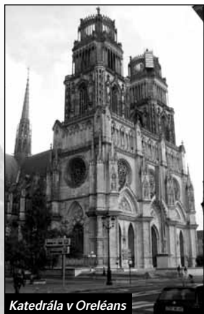
Katedrála v Orléans