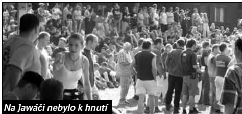
Na Jawáci nebylo k hnutí

Sraz Jawaklubu Praha v Jizbicích se stal v minulosti jedním z našich nejoblíbenějších. Na letošní ročník této spíše menší akce jsme se proto hodně těšili. Ovšem zprávy od lidí, kteří vyjeli už v pátek zabrat plac pro stany, nás trochu znervóznilly. Už v páteční večer bylo totiž problém sehnat kousek volného místa. Po sobotním příjezdu do Jizbic v době vyjíždky se splnila nepřijemná předpověď - v minulosti spíše rodinný srazek se stal megaakcí. I samotní organizátoři byli zaskočení letošní účastí. Motoroky a stany se vůbec nemohly nacpat do prostoru rekreačního areálu, a tak se zaplňovaly i okolní lesy. Nedostatečný počet výčepů a stánků s jídlem způsoboval nekonečné fronty žízničných a hladových motorkářů. Prostor před pódiem i na svazích přilehlé vodní nádrže byl beznadějně zaplněn. Pro mnoho lidí to byl jeden z posledních srazů v pěkném počasí, a tak si ho asi nenechal nikdo ujit.