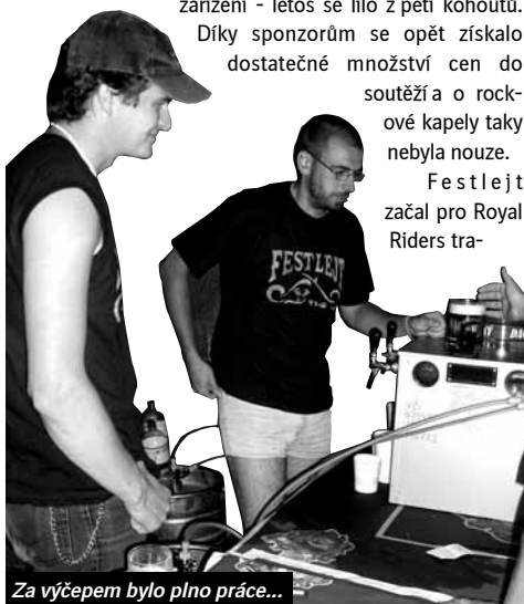
Za výčepem bylo plno práce...

dičně už ve čtvrtěk. Navezlo se vše potřebné, postavilo se pódium a vyzkoušely se výčepy. V „seminární“ den si tak dostatečně popili i samotní organizátoři.