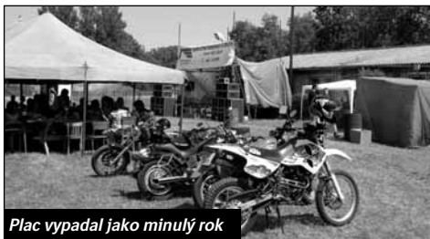
Plac vypadal jako minulý rok

poprvé ze všech Festlejtů hrálo na živo už v pátek. Na známou kapelu Něco z Týnce nad Labem a partičku pod názvem Koroze přijeli zapařit a popít hlavně ti, kteří jezdí na Fest Lejt už „léta“. Ovšem i pár nových zlemtaných tvář se potácelo po place.