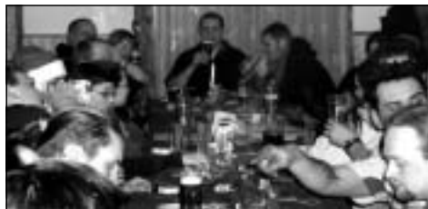
Hospodu v Hlízově plně obsadili motorkáři...