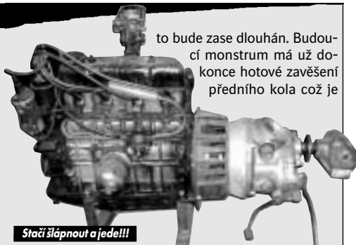
Stačí šlápnout a jedeme!!!

Petr se naopak plánu na „škodováčkou“ motorku nevzdal. Motor získal od Huga a převodovku z Dněpra pořídil na burze. Pár zimních večerů pak vyráběl spojovací mezikruží a výsledkem je smontovaný kompletní mechanismus. „Kdo nevěří ať tam běží“, protože Škůdka jde nyní opravdu v pohodě našlápnout nožní pákou a šlape jak hodinky. Díky nutnosti osadit stroj širokou zadní gumou je za převodovkou ještě „úhlovka“, takže