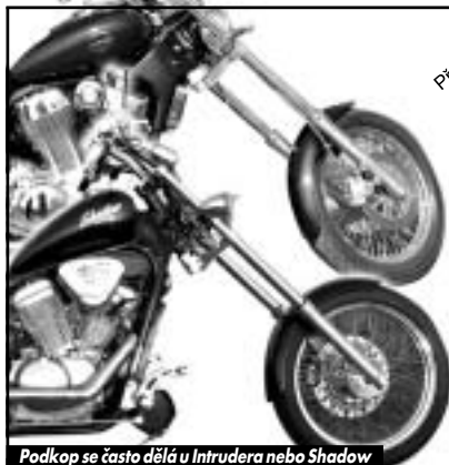
Podkopy se často dělá u Intrudera nebo Shadow