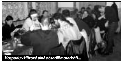
Hospodu v Hlízově plně obsadili motorkáři...