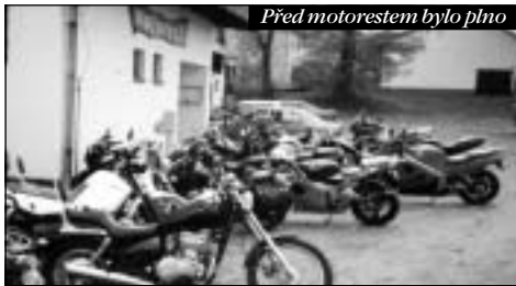
Před motorestem bylo plno