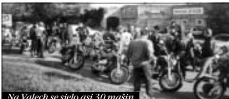
Na Valech se sjelo asi 30 mašin

Po neustálým odkládání symbolického ukončení letošního vydařeného sezóny „podzimní vyjíždkou“, jsme stanovili termín na neděli 20. října 2002. O tom, že chceme v posledních mrazivejch říjnových dnech vyrazit na dvou kolech do překrásně probarvený krajiny, se motorkáři mimo klub mohli dovědět jen z pochybný věty: „Hele, v neděli je vyjížďka, tak kdyžtak přijeď“. Odpověď bylo: „V tomhle zasným počasí chcete někam jet?!“, když se dotyčný kouklul z okna na padající kapky deště a teploměr pod deseti stupněma. Možná z frajeřiny, ale spíš z „absťáku“ po jízdě jsme říkali: „Jedem za každého počasí!“. Tato silácká věta udělala asi dojem na „toho nahoře“, a tak v neděli rozfoukal mraky a ukázal nám mozaiku azurový obloze. Do kamen mohli sice nalejt trochu ředidla, protože teplota byla stále okolo deseti stupňů, ale „díkybohu“ za ně, mohlo bejt hůř.