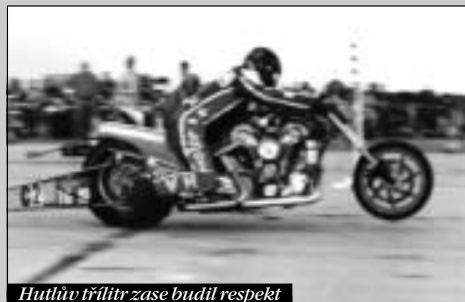
Hutlův třílitr zase budil respekt

Jednou z posledních veřejných moto akcí, které jsme se zúčastnili, byl tradiční závěrečný závod Mistrovství Český republiky dragsterů v Kolíně. Během docela vydařeného dne jsme se pokochali pohledem na nadupaný mašiny a jejich nastartovaný motory nám podráždily bubinky v uších. Právě díky pěknému počasí se sem sjelo dost diváků, takže bylo v depu a přilehlém parkovišti na co koukat.