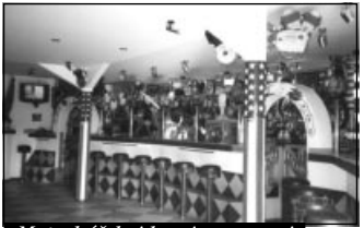
Motorkářskej bar je vzorovej

hodně "MOTO CLUB" v Benešově. Takže jsme neváhali, nasednuli na stroje a krkolomnou cestou přes Českéj Brod, Mukařov a pár dalších prdelí, jsme se dovolili k ráji motorkářů.