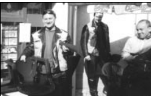
Židle na sračky, úsměv na tváři

V neděli 14. října se tedy za krásného počasí sjela hrstka "našich" jedenácti motorkářů, tradičně, na parkovišti Na Valech. Okolo půl dvanáctý jsme pak vyrazili směr Kolín, Poděbrady, Nymburk a Lysá nad Labem. Cíl a samotnou cestu jsme předem neplánovali, takže se Lysá stala takovým objektivním místem, kam naše kolona zavítala. Protože žaludky cestou vyhládlí zašli jsme tam i na gábl do první restauračky, co jsme uviděli. Ta se stala osudnou pro Strndů, pod kterým se při usedání totálně rozlámla plastová židle. To dost pobouřilo vedoucí tyhle puťky za všechny prachy, a tak musela být židle připočtena k objedu. Jestli se teda chcete fakt nasrat a zároveň nasrat někoho jiného,