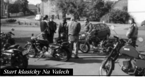
Start klasicky Na Valech

Motorkářská sezóna pomalu končí a tomu odpovídalo i počasí v září. Ovšem začátkem října přišlo, už nikým nečekaný, pravý babí léto. Ručička teploměru vystoupala nad dvacítku, a tak se po krajině vobalený mlhavým oparem, který prosvícuje podzimní slunce na jasný obloze, začali zase objevovat motorkáři vychutnávající si jedny z posledních příležitostí protáhnout svého miláčka bez rizika omrzlin či špatného startování.