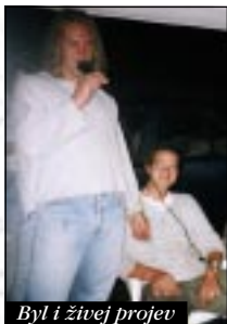
Byl i živěj projev

ha byla totálně azurová. Tím chceme říct, že se o nás motorkářské Bůh staral po celé víkend. Po celou dobu bylo totiž nádherný až nesnesitelný vedro, na rozdíl od dní předešlejších, kdy festově chcalo.