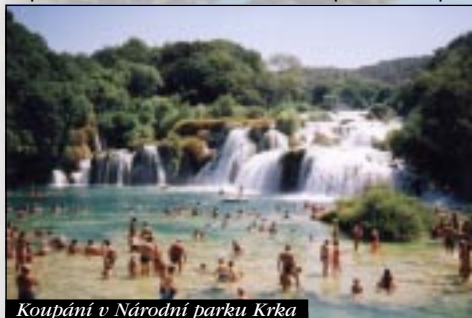
Koupání v Národní parku Krka

Příští den, ve čtvrtek, jsme okolo devátý ráno nasadili na motorky a vypravili se do národního parku Krka, zdálenýho asi 50 km. Při nádherný jízdě krajinou prasklo znovu Růžovi lanko a Bob, na potvoru zase píchnul, ale "našťěstí" už na parkovišti u parku. Takže jsme nechali stroje strojema a zaplatili 45 Kun za vstup do přírodní rezervace. Tam nás odvezl místní autobus krutejma serpentyňama. Procházka parkem stála rozhodně za to. Hlavně pohled a koupání