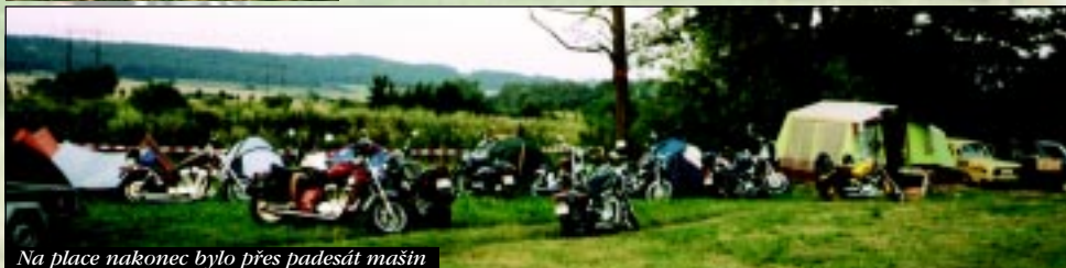
Na place nakonec bylo přes padesát mašin

A co říct na závěr. Snad jen to, že platilo znovu to, co každé FEST LEJT, kdo zde nebyl, ten rozhodně prohloupil. Dokázali jsme, že umíme udělat dobrou akci nejen pro sebe, ale taky pro širokou motorkářskou komunitu a táhneme za jeden provaz. Setkání se zúčastnilo asi sedmdesát lidí, vypilo se osm sudů piva a zabilo milióny mozkových buňek. FEST LEJT znova dokázal svoje jméno a všichni se už těšíme, tam někde v klukovskym srdci, na další ročník, i když si to pár dní, než se naše těla a stroje zotavěj, nepřipustíme. Takže na FEST LEJTU 2002 navíděnou.