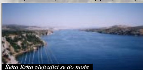
Reka Krka vlejavající se do moře

Když jsme se vrátili do kempu, následovalo ještě povinný koupání v moři a večerní pijatyka, při který málem došlo naše český pivo. Našťěstí přijel další člen skupiny, a tak bylo znovu o plato navíc. (Jinak Chorvatský piva jsou asi tyto: