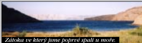
Zátoka ve kterýj jsme poprvé spali u moře.

Ráno nás probudil ohromnej vítr. Lítalo vše, dokonce i Médův pitlík na spacák, kterej nakonec opravdu uletěl.