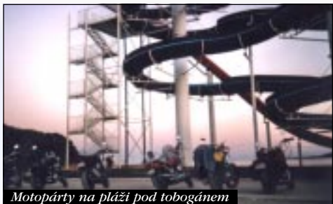
Motopárty na pláži pod tobogánem

Poslední den byl shodnej s předchozím. Každěj měl ještě šanci nacytat nějakej ten bronz a osolit se ve vodě. To už bylo všem smutno a přáli si, aby tahle idyla nikdy neskončila.