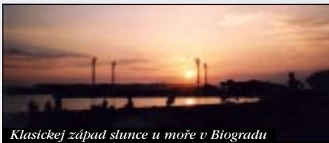
Klasickej západ slunce u moře v Biogradu