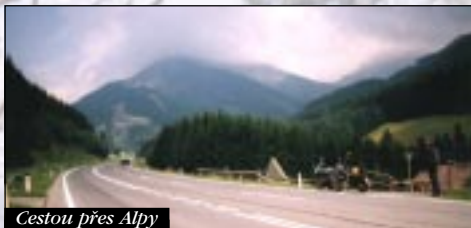
Cestou přes Alpy