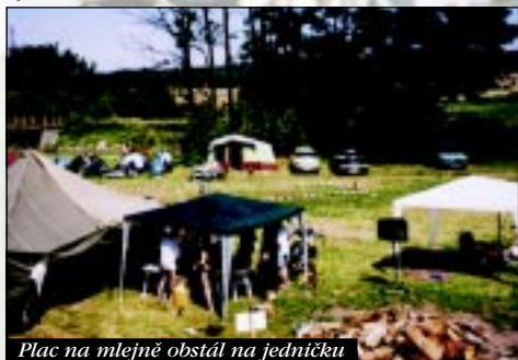
Plac na mlejně obstal na jedničku

S rokem 2001 přišlo nový tisíciletí a taky třetí ročník FEST LEJTU, na kterej jsme se všichni těšili. Myšlenka akce stále zůstávala, letos nás ovšem lákalo zorganizovat něco většího, něco nejenom pro nás, ale hlavně pro lidi, co přijdou. S tímto přecevzetím jsme taky vstoupili do tohodle významnýho roku.