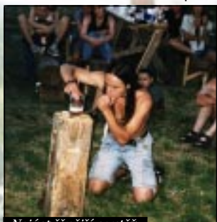
Nejúspěšnější soutěž: pití piva na ex metrovou hadicí

Hned první "sající" člověk vzbudil v lidech nadšení. A když viděli, že to jde, šli do toho taky. Časy byly různé a pohybovaly se okolo deseti sekund, až do chvíle kdy padl rekord 8,42. To už se soutěž zvrhla v sací závod a některý nezmaří,