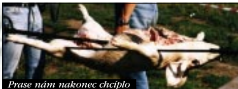
Prase nám nakonec chčíplo

Rudla, Čudla..., měli až šest "opravnejch" půllitrů na SEX (sací ex). Tím pádem se bez problémů vypilo půl sudu piva metrovou hadicí. To už držel mikrofon Ježíš a jeho komentář po zbytek akce vstoupil do "análů" (např. věta po exu piva: "Lidi jsou prasata, jdu do nebe").