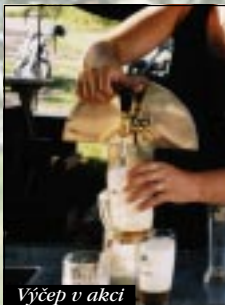
Výčep v akci

Ráno 28. července bylo sice těžký, ale po hlasitým řvaní do mikrofonu: "Vstááááávat!!!", bylo jasný, že se už nikdo nevysspí. Po otevření očí do nich páli sluneční paprsky a oblo-