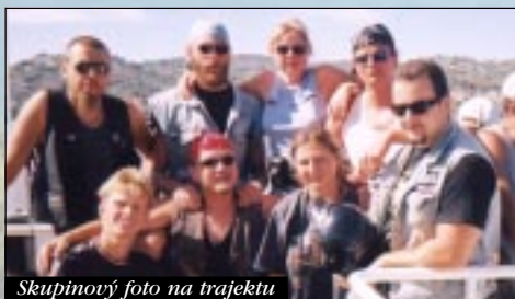
Skupinový foto na trajektu

Na pondělí připadnul další výlet. Ráno jsme najeli na motorkách do trajektu Jadrolinija z Biogradu do Tkonu a nechali se převést na neďalekej ostrov (7 Kun za osobu a 14 za mašinu). Tam se podnikla spanilá jízda průměrnou rychlostí 40 km/h. Našli jsme dokonce snovou zátoku, kde se pár z nás neúnavě potápělo pro mořský potvoru.