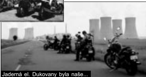
Jaderná el. Dukovany byla naše...