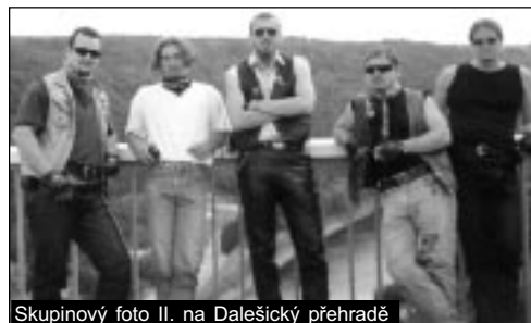
Skupinový foto II. na Dalešický přehradě

kde část skupiny navštívila zdejší zámek a druhá zašla na zmrzlinu. Zpáteční cesta, přes Lipník do Dalešic na oběd, stála taky za to. Skoro žádný auto, rovná silnice s výhledem na letní, "jižní" krajinu.