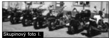
Skupinový foto I.

V pátek následovala další výjezdka. Tentokrát vedla nádhernou silnicí do Jaroměřic n/Rok.,