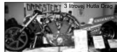
3 litrověj Hutla Drag

Veletrh Motocykl v březnu plní však v duchu motorkářským trochu jiné účel než je výstava. Při pohledu na tu spoustu nablejskanejch mašin se v srdci motorkáře