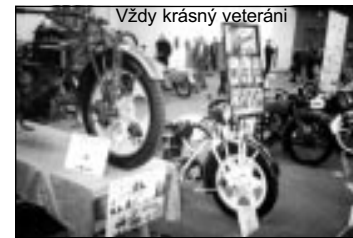
Vždy krásný veteráni

15. až 18. března se konal již tradiční veletrh, svátek motorkářů, Motocykl 2001. Jako klub jsme na něm samo nesměli chybět, a tak jsme v sobotu 17. 3. sednuli do starý Medvědoj Škúdky, která dva dny před jízdou dostala menší prdu na čumák, a odjeli do matičky Prahy. Že jsme podnikli akci v autě, nás ani nemrzelo, protože celý odpoledne chcalo a motorkářům