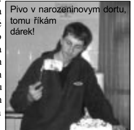
Pivo v narozeninovym dortu, tomu říkám dárek!