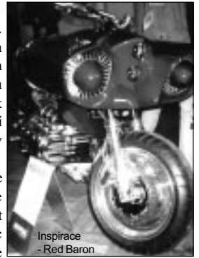
Inspirace - Red Baron