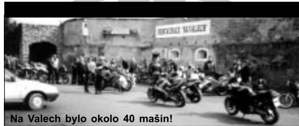
Na Valech bylo okolo 40 mašin!

"Sezóna je tady!" To si většina z nás myslela už někdy na začátku března. Jaro sice vystrčí své růžky prvníma telpejma dněma už asi před měsícem, ale co "kurva nechtěla" zase se to posralo, a tak nastala sága zasnarejch dní pod mrakem, s deštěm a teplotou okolo nuly, prostě na hovno. Ovšem ještě než se počasí tenkrát "pokazilo" naplánovali jsme jako klub zahajovací vyjížďku dobřej měsíc dopředu. Toho jsme však vzápětí trochu litovali s přibíjajícím mrazem a někdy i sněhem. Termín byl jasnej - poslední březnovoj den. Jak se to blížilo a obloha se ne a ne vyjasnit, přestávalo hodně z nás věřit v úspěch týhle akce. I přes to se rozdalo pár pozvánek ostatním motorkářům, a tak se akce stala závaznou.