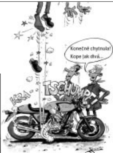
Obrázky vtipů pocházejí z motokářských stránek: www.baladamoto.aadi.fr Zaserfujte tam!