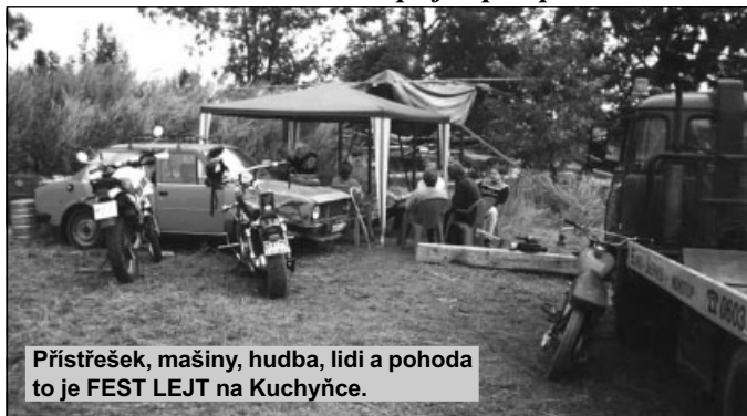
Přístřešek, mašiny, hudba, lidi a pohoda to je FEST LEJT na Kuchyňce.

Příprava na celou tuhle šílenost proběhla vcelku bezbolestně. Prachy byly, jen se rozvrhlo, jak je utratit. Takže se pořídily tři soudky, deset kuřat, sedmdesát vufťů, nějaký vody na ranní vstávání, a další věci, co jsou potřeba k tomu, aby se mohlo bezstarostně LEJT. Původní zahájení se plánovalo na sedmou hodinu v pátek. Ale protože se věci sami na plac nedostanou a někdo je musí přivést, zdrželo se naražení prvního soudku a spuštění první rock music vo nějakou tu hodku. Stejně tak se někde zdrželo hezký počasí, a tak veškerá akce probíhala za stálého poprchávání, a to až do neděle. Nějak jsme však za těch pár let votupěli, takže nám nějaký zkurvený, zasraný počasí nemohlo zakzit náladu, narozdíl vod toho, jak jí dokáže zkazit na jiný motoakci nebo srazu.