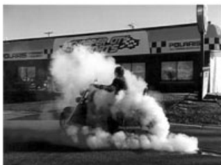
Obrázek: „Vohulte start do roku 2000 !!!“

Royal Riders tímto vstupují do druhého roku své existence a tak doufáme, že bude ještě úspěšnější než ten, co právě skončil. (Důkazem může být první vyjížďka dvou členů v druhém roce klubu, která se konala 28.11.1999 při venkovní teplotě zhruba 2-4°C).