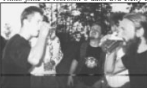
motorkaření to je dřina, ale novým členům chutná.