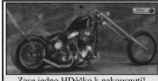
Zase jedno HDěčko k nakousnutí!

I když nám náš plán s pořádáním klubový akce nevyšel, nenechali jsme si zkazit krásnej večer a noc ze soboty na neděli. Nasedli jsme na mašiny a v skromnym počtu třech lidi jsme vyrazili na Sázu. Zapadající slunce nám dělalo radost svým probarvením krajiny. Cílem byla hospoda nedaleko Stříbrný Skalice pod jménem NA MARIANCE. Po chvíli posezení v příjemnym prostředí nám to nedalo a vydali jsme se na noční projížďku, no spíš cestu do 40km vzdálených Paběnic, kde jsme skončili zprvu v hospodě na kulečnicku a poté na zábavě, kde jsme všude šířily pověst našeho klubu.