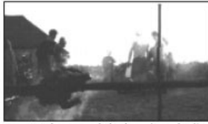
z prasete toho moc nezbylo, ale my jsme zůstali celi.