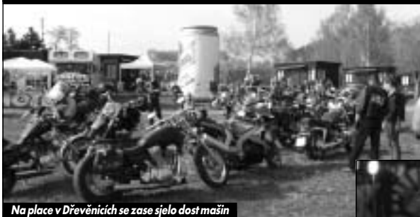
Na place v Dřevěnicích se zase sjelo dost mašin

dičních soutěžích probíhajících před publikem ví jen málo. To také trochu značí to, že úroveň zábavy těžce skomírala a zápolící podnapilí soutěžící už moc lidí nebrali. Z programu srazu by se tak dali pochválit jen kapely jako Janis Joplin revival a Visací zámek, který donutil většinu přesunout místo konzumace piva před podium.