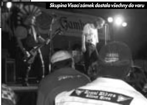
Skupina Visací zámek dostala všechny do varu

Venkovní teploty se pomalu vyhouply nad dvacet stupňů nad nulou, a tak nastala ta pravá chvíle na první větší motosrazy.