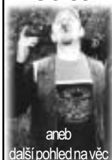
aneb další pohled na věc

Nazdarr bazarr a taky masakrrr. Krásný slova, co? Ty jsem si vypůjčil od Rudly. Ty neznáš Rudlu?? Nekecej. To je ten zmuchlanej cloviček támhle pod lavičkou, koukej. No nesměj se, nebýváš na tom o moc líp. A netlem se tak blbě. Chápu, že jsi v euforii, že si můžeš po více jak dvou měsících přečíst naše supervýtvořky, ale to neznamená, že budeš celému světu ukazovat ty tvoje zaplombované stoličky. Tak co? Jak se ti to čte? Dobrý? Nekecej! Fakt? Ty jsi něco pil!!! A co, byl si s náma někde?? Záměrně nefkám se mnou, protože já byl pouze na dvou akcích (narozky a Svojsice), z toho z první jsem si přinesl Window a z druhé výkladní skříň. A prej tam taky po mě něco zbylo. Pizza bez buchy. No a co?? Ty ses nikdy nepobilil??? To je jako kdybys řekl, že jsi nikdy neonoval. A co na FestLejt, přijedeš??? Tak si hlavně přines pulitr, protože kelímky jsou drahý... Pro dnešek stačí, ne?