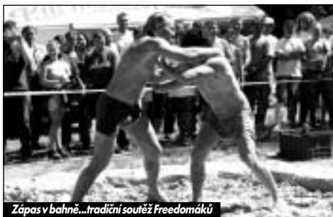
Zápas v bahně...tradiční soutěž Freedomáků

Od sobotního rána se na akci začali sjíždět další příznivci jedné stopy. Část kutnohorských motorkářů také nechala příjezd až na sobotu, takže po poledni jsme se mohli pyšnit skoro plným zastoupením všech „postižeňech“ z našeho působíště. Mohutnou účast zde měla samozřejmě i Kolínská verbež.