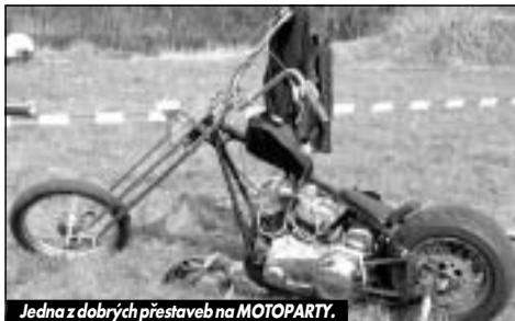
Jedna z dobrých přestaveb na MOTOPARTY.

Pítí a klábosení mezi stovkami motorkářů, kteří se vrátili z vyjížděk, všechny zaměstnalo natolik, že o tra-