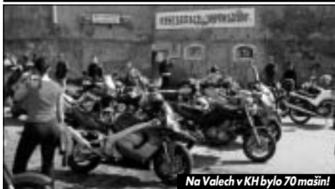
Na Válech v KH bylo 70 mašin!

Na Velikonoční neděli 20. dubna 2003 uspořádal kutnohorský motoklub Royal Riders každoroční zahajovací vyjížďku. Na rozdíl od minulých let byla akce naplánovaná dost dopředu, takže se muselo spolehat na počasí. To udělalo o svátečním víkendu radost nejen návštěvníkům probíhající Sedlecké pouti, ale i všem motorkářům, kteří se vydali na první větší akci Royal Riders. Vědělo o ní sice dost lidí, ale když se v jedenáct hodin sjelo sedmdesát mašin na parkovišti Na Válech v Kutné Hoře, byla to rekordní účast ze všech dosavadních vyjížďek. Počty okolo třiceti mašin jsou tím historií a můžeme se těšit na první stovku, a to snad už příští rok. Při klábosení a zdravení lidí, kteří se přes zimu neviděli, se počkalo na poslední opozdilce a mohlo se vyrazit.