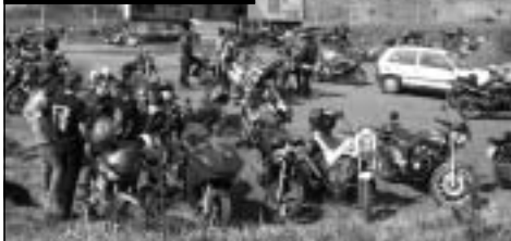
Plac v Benešově skoro nestačil...

Příjemným setkáním lidí, kteří podlehli kouzlu dvou kol, a společnou jízdu se tak symbolicky odstartovala další kutnohorská motorkářská sezóna. Ta bude plná dalších vyjížďek, motodovolených a návštěv srazů.