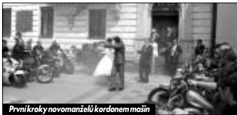
První kroky novomanželů kordonem mašin

motocyklů. „Civilní“ svatební hosté byli pak v pozadí, když se páru ujala Kolínská verbež. Po nezbytném focení, přivázání a odemčení věžeňské koule z nohy novomanžela se znovu šlo ke strojům. Následovala totiž spanilá jízda do hospody v Osečku, kde byla připravená hostina.