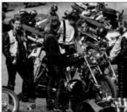
Velikonočním setkáním lidí, kteří jedlihli kazuu spojené dnu kol, začala letošní motokářská sezóna.

Letošní sezóna má být plná dalších výstřelků, motodrovoletných a návštěv srazů, mezi kterými nebude chybět pátý ročník akce nazvané Fest Let v Žibohň nad Labem. (N)