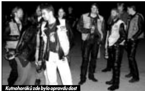
Kutnohoráků zde bylo opravdu dost

Na IX. Srazu motocyklistů pod taktovkou klubu Freedom jsme se tedy vydali s jistou nostalgii a to většina již v pátek. Výjezd tradičně z parkoviště na Valech v Kutné Hoře byl odložen až na půl osmou večerní, a to díky pomalosti balení Medvěda. Na pár kilometrů vzdálený sraz, asi 40km, jsem však dojel v pohodě za světla. Vstup na plac za dvě stovky byl v pohodě a pivo za 17 kačen s kelímkem, který se čepovalo nejméně z pěti samostatných výčepů, každého potěšilo. S žlutým mokem to mají organizátoři zmknutý už dlouho, vždy je zde s ním víc kohoutů než momentálně žiznivejch krků. Na první den přijelo přiměřeně motorkářů, takže se nikdo