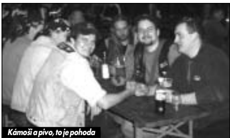
Kámoši a pivo, to je pohoda

Závěrem můžeme říct, že úroveň megasrazů hodně stagnuje a na letošní MOTOPARTY byl znát i jistý propad. Soutěže už ztrácejí na atraktivnosti, sex show jsou okoukané a jen ty lepší kapely trochu drží zábavu nad vodou. Naštěstí na prvním větším srazu jde spíš o to, aby se znovu v nové sezóně setkali příznivci jedné stopy, poklábosili, seznámili se s dalšími, vyměnili si své názory, předvedli nové stroje a holdovali společně pivu. Takže příští rok...možná.