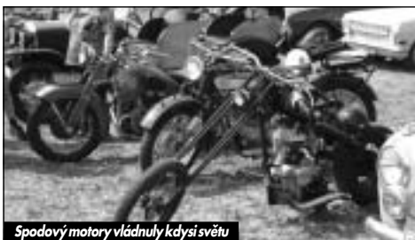
Spodový motory vládnuhly kdysi světu

Akce pak pokračovala pohoštěním na place, ale většina „dědečků a babiček“ už zamířila zpět domů do rodné stodoly či garáže. Příští rok se však znovu vrátí do starých časů na Puchěř.