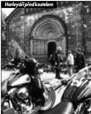
Harleyáři před kostelem

Io se něco kolem 150 mašin převážně z klubu Harley-Davidson Praha a H.O.G. Chapter Praha. Bylo na co koukat? K vidění byly jak nové stroje H-D V-ROD tak