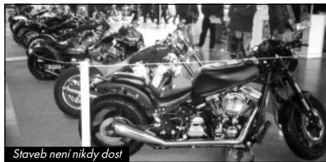
Staveb není nikdy dost