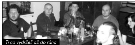
Ti co vydrželi až do rána

V první jarní pátek roku 2003 jsme tedy sednuli do plechovek, někdo i do mašiny, a vydali se pít do Uhlířských Janovic. Účast motorkářů zde byla vysoká. Zprvu převážovaly členové rychle rozrostlého Kolínského spolku Kolínská Verbež, ale po osmé hodině se dostavili i kutnohorští příznivci jedné stopy. Zábava se rychle rozjela a k pití a vynikajícímu jídlu jsme mohli sledovat video se srazy a motorkářskými filmy. Rozhovory nejen o mašinách nabírali na obrátkách s přibývajícím množstvím alkoholu. Došlo i na túrování přítomných strojů