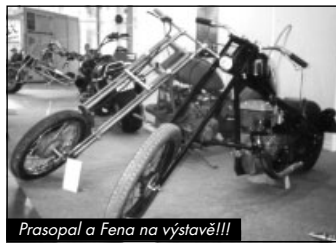
Prasopal a Fena na výstavě!!!

horské stavby rozhodně neztratily a dokonce sklidily nečekaný obdiv. FENA s motorem z třicátých let minulého století a dlouha-