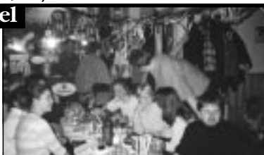
Šance byla „naše“... nechyběla výzdoba... a hlavně zde byla pohoda...

Hned po příchodu prvních známých v ten slavný den bylo jasné, že slavnostní tabule o dvou stolech nebude stačit, a tak se natáhli stoly přes celou místnost. Čas začal neskutečně ubíhat a najednou byla půlnoc a chvíle pro užití velkého množství našich výbušnin. Hospoda i po tomto „úkonu“ zůstala celá, takže jsme mohli pařit až do rána, spolu s dalšíma známějma, co přišli po půlnoci. Oslava skončila, podle očtých svědků, někdy před osmou hodinou ranní. To však už většina z nás spala v teple domovů. Jen pro uklízečku v restauraci asi nebyl ranní šok z rozbitých skleniček, rozmázejích chlebičků kam se podíváš, výlitejch piv a kdoví čeho ještě, tím pravým vstupem do Novýho roku 2002, kterej jsme my tak pěkně oslavili.